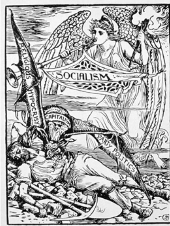
WALTER CRANE, "The Vampire", 1885.

Ο κοιμισμένος εργάτης, που απομιζιέται από το βαμπίρ του καπιταλισμού, ετοιμάζεται να ξυπνήσει από την αγγελική φιγούρα του Σοσιαλισμού.