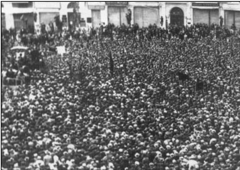
Κυριακή 10 Μάη. Ο λαός της Θεσσαλονίκης κηδεύει τα θύματα της εξέγερσης